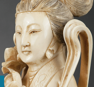
© Hong Kong. Statuette en ivoire