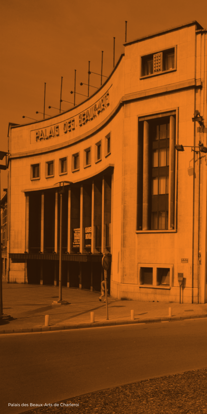
Palais des Beaux-Arts de Charleroi