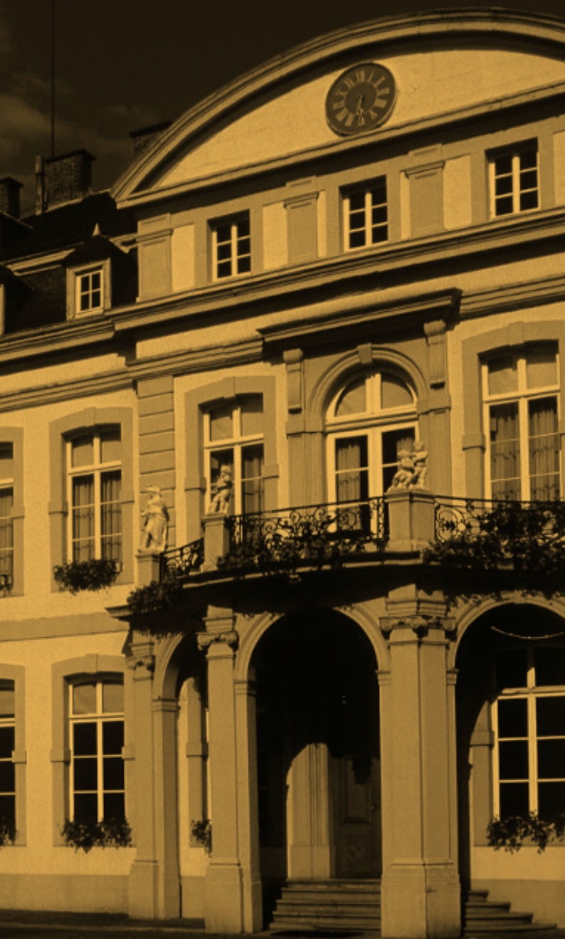
Palais provincial de Namur