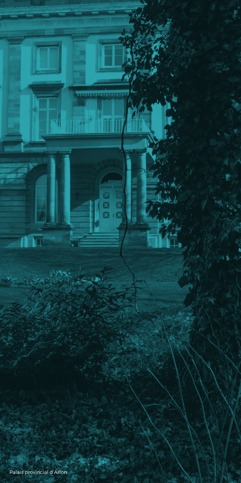
Palais provincial d'Arlon